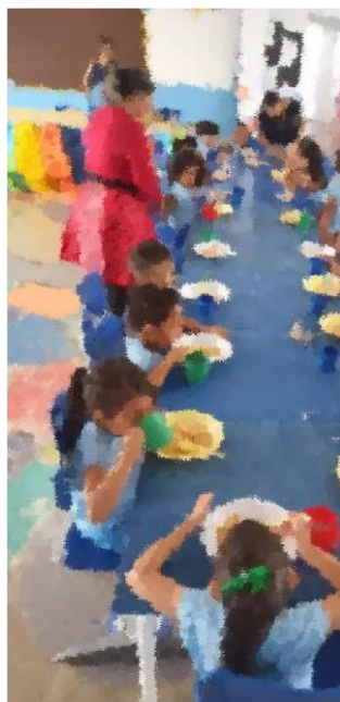
Hora do lanche. Cardápio frango, com arroz e cenoura ralada e suco.