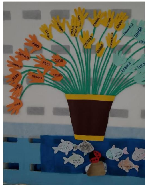
Algumas das produções dos alunos da pré-escola e maternal.