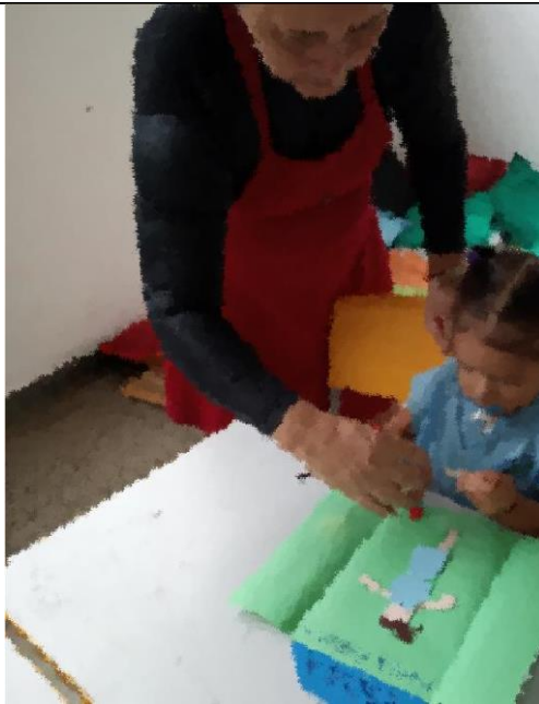
Maternal produzindo para o projeto que será trabalho no ano letivo de 2022, Projeto Identidade.