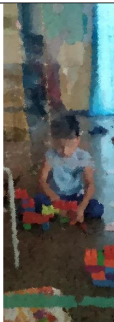
Hora do descanso na Brinquedoteca. Sala climatizada, onde as crianças sentam para brincar e relaxar.