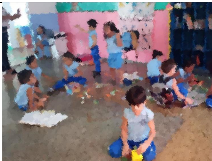
Crianças maternal e pré-escola. Brincando com jogos de montar, quebra cabeça e brinquedos.