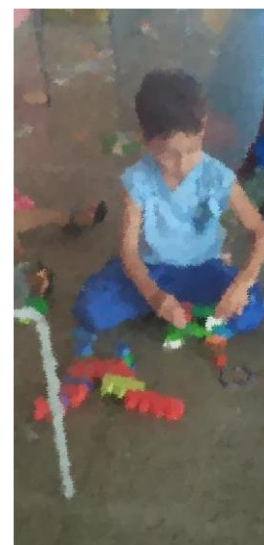
Montando carrinho. um