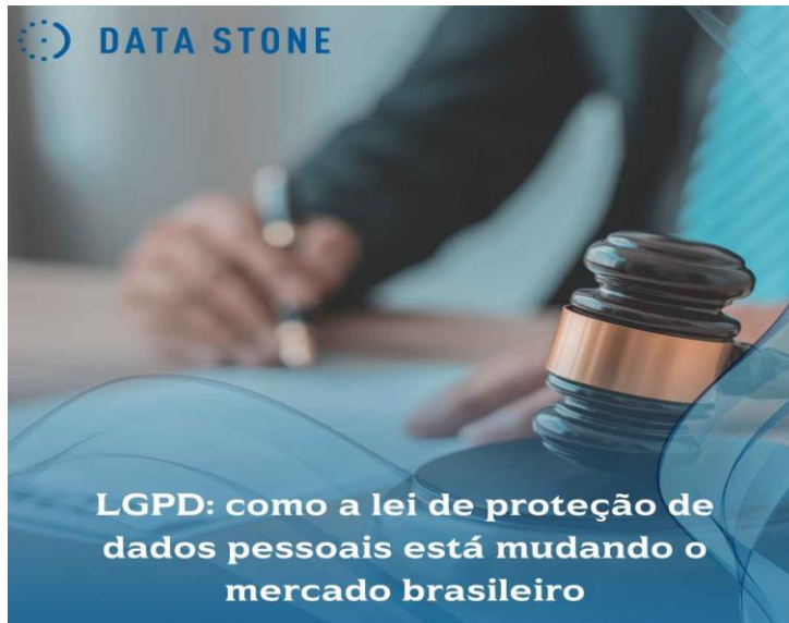
Figura 4 - LGPD no mercado brasileiro