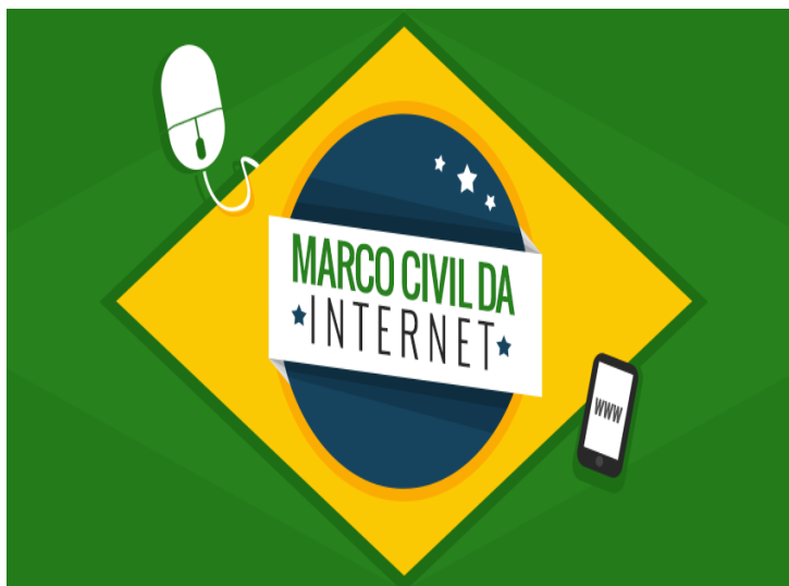
Figura 5 - Marco civil da internet