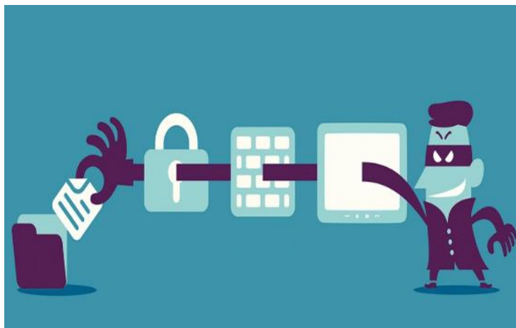
Figura 2 - Proteção de Dados