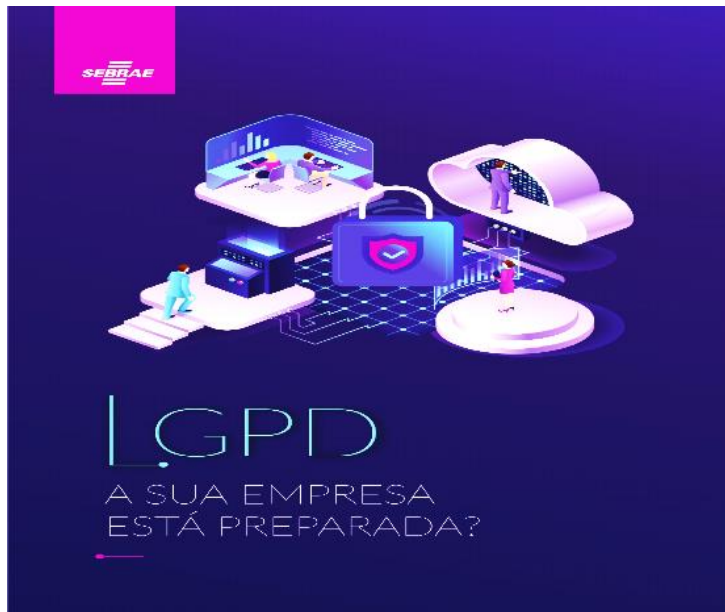
Figura 8 - LGPD a sua empresa está preparada?

um aplicativo de teste de personalidade para acessar dados. Geralmente, a obtenção de dados pessoais é feita na própria internet, por meio de robôs que acabam acessando sites que disponibilizam informações, e com isso eles conseguem capturar essas informações das pessoas.