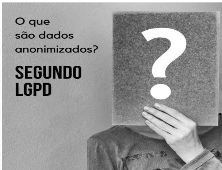
Figura 6 - O que são dados anonimizados?