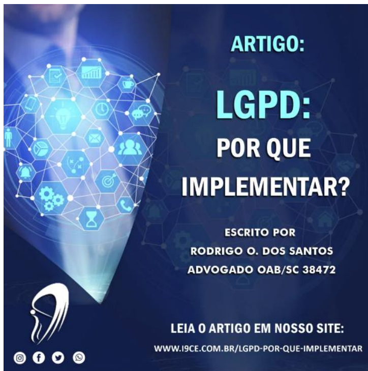
Figura 9 - Por que implementar a LGPD?