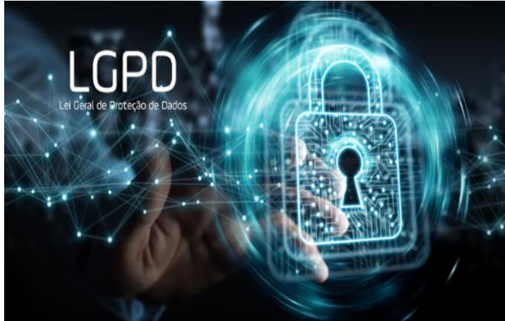
Figura 1 - Lei geral de proteção de dados