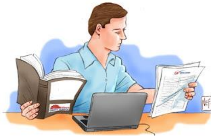
Figura 3 - Metodologia