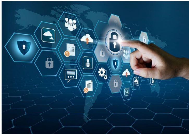
Figura 7 - LGPD no dia a dia das empresas