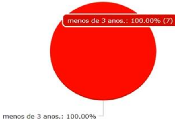
Gráfico 01 - Experiência na Docência

Conforme as respostas, apenas sete professores responderam essa questão e conforme o gráfico 01, 100% dos participantes responderam a primeira opção, qual seja, menos de 3 anos.