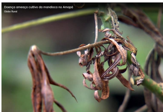
Figura 5: Estágio final da DVBM: necrose e secamento total da planta.

Explicação técnica: Álvaro Cavalcante (DIAGRO-AP).