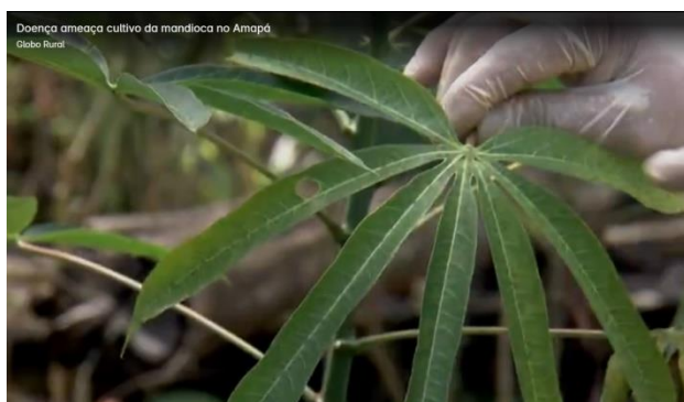
Figura 1: Amarelecimento das folhas superiores

Explicação técnica: Álvaro Cavalcante (DIAGRO-AP).