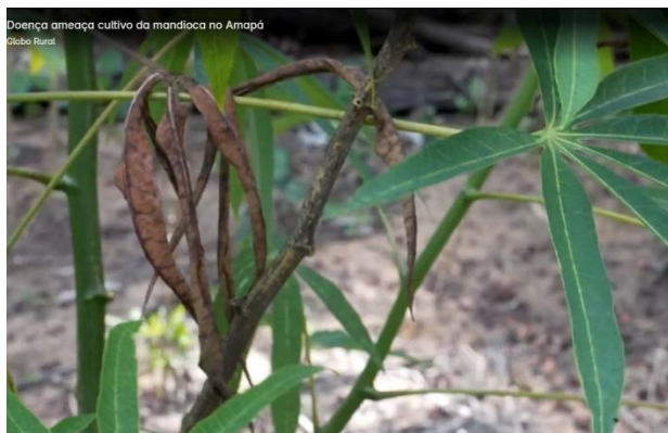
Figura 3: Afinamento das hastes e perda de vigor estrutural da mandioca.

Explicação: Álvaro Cavalcante (DIAGRO-AP).