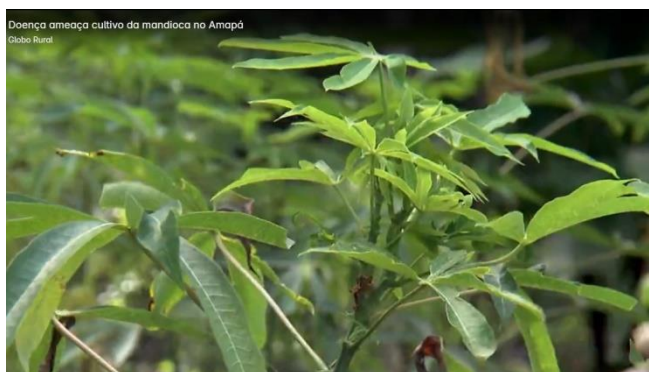
Figura 2: O superbrotamento em manivas de mandioca.

Explicação técnica: Álvaro Cavalcante (DIAGRO-AP).