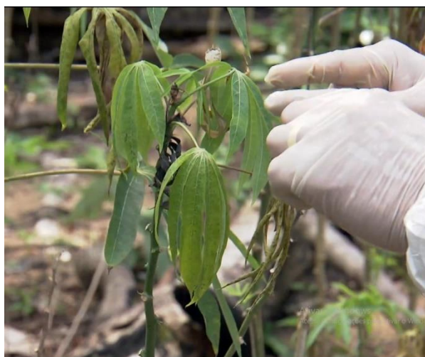
Figura 4: Estágio avançado de envassouramento (superbrotamento lateral).

Explicação técnica: Álvaro Cavalcante (DIAGRO-AP).