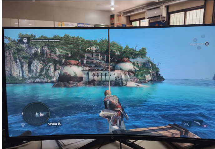
Figura 6 – Forte militar de proteção nas margens do mar (Fortaleza Militar).