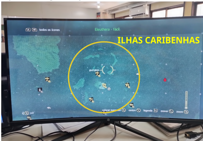
Figura 4 – Mapa da região das Ilhas Caribenhas.