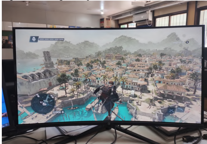
Figura 5 – Paisagem da província de Havana no Século XVIII (Cuba).