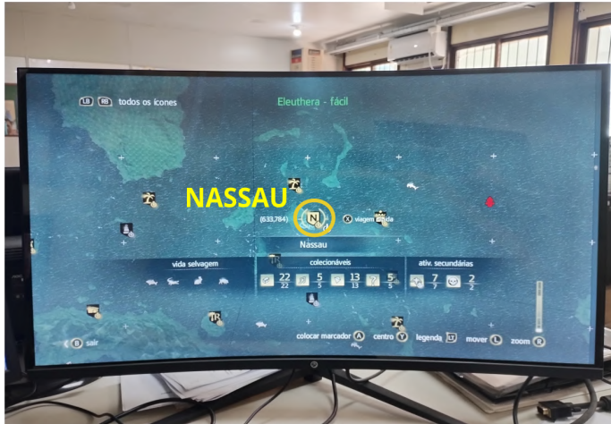
Figura 3 – Mapa da região de Nassau.