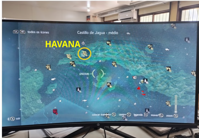
Figura 1 – Mapa da região de Havana.

O uso da tecnologia e da imagem no game permite aos alunos visualizar a geografia complexa das ilhas, os modelos de embarcações da época (como galeões espanhóis) e as estruturas coloniais (SILVA, 2014). Essa aprendizagem visual e imersiva são ricas para a construção de um "universo imaginativo" histórico, servindo como uma ponte inicial para a compreensão dos temas de História Colonial (VIANA, 2024).