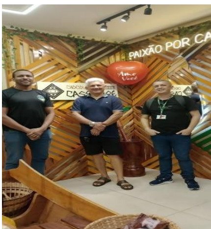
Figura 4 – Loja da fábrica