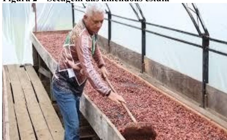
Figura 2 – Secagem das amêndoas estufa

Etapa de secagem em estruturas improvisadas próximas à residência do produtor.