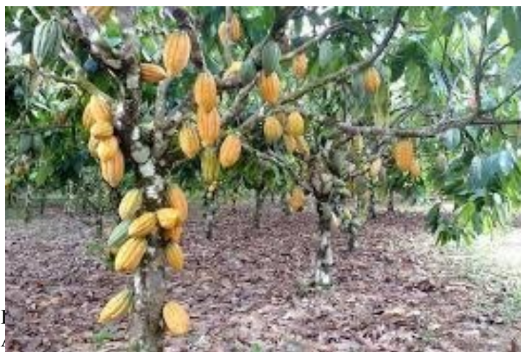
Figura 1 – Cultivo do cacau na região do Cassiporé