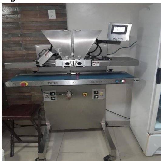
Figura 5 – Pré refino