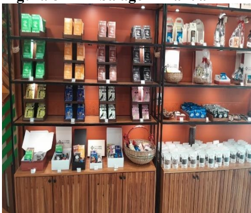
Figura 8 – Embalagem manual

Prateleiras organizadas ou espaço de vendas