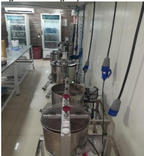
Figura 4 – Refrigeração