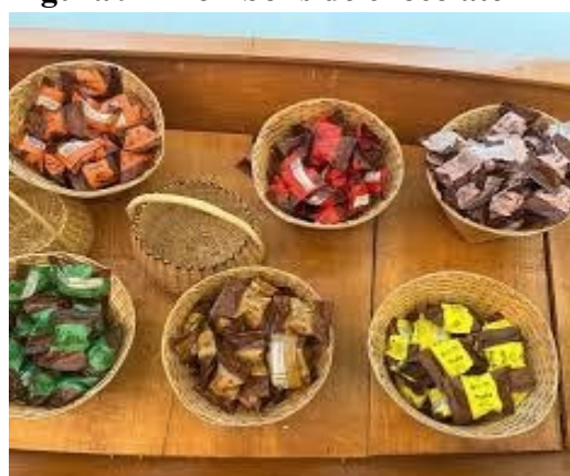
Figura 9 – Bombons de chocolate