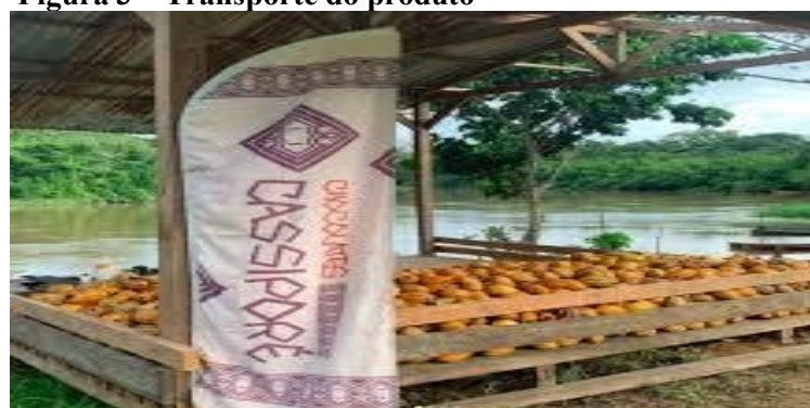
Figura 3 – Transporte do produto

Amêndoas no Rio Cassiporé em direção ao centro urbano.