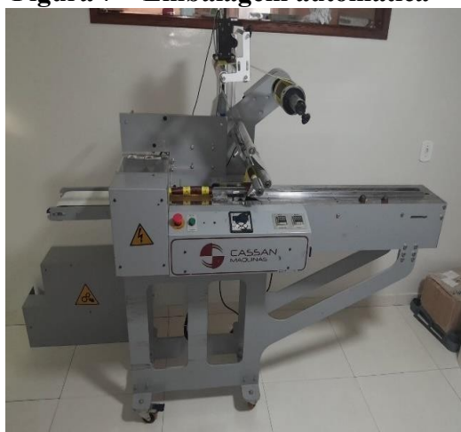
Figura 7 – Embalagem automática