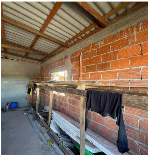
Figura 4 - Parede em construção com tijolos de 8 furos (tijolão)

O pedreiro A descreve que para facilitar a compra de materiais, costuma-se arredondar o a quantidade. Nesse caso, o uso de aproximadamente 200 tijolos (tijolão). Essa estratégia permite evitar desperdícios e garantir maior eficiência na execução da obra.