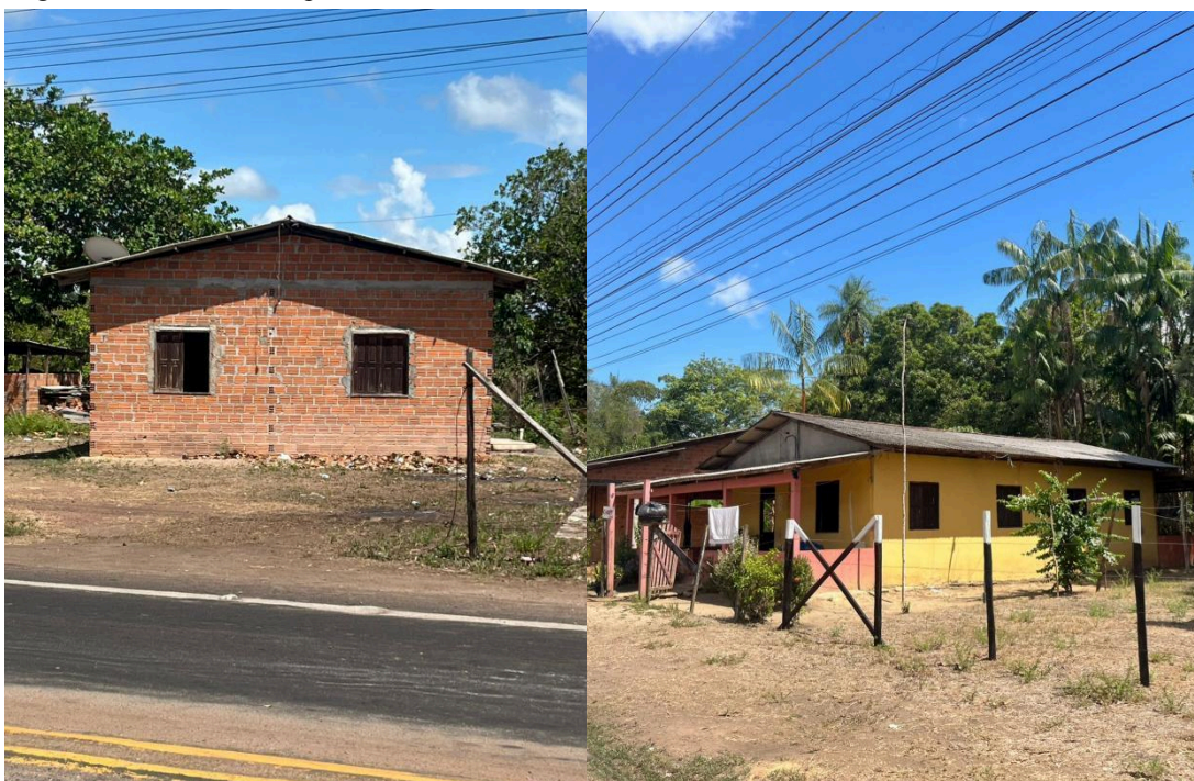
Figura 3 - Residências típicas na Comunidade Quilombola do Curiaú

Essas celebrações reforçam a continuidade das raízes etnoculturais do grupo e atraem visitantes interessados na riqueza histórica do local. Ainda segundo Morais (2011), a mandioca é o principal cultivo da comunidade, utilizada principalmente na produção artesanal de farinha. Também são cultivadas hortaliças e frutas em pequena escala para consumo local, além da coleta e comercialização do açaí, produtos que compõem a base da alimentação cotidiana dos moradores.