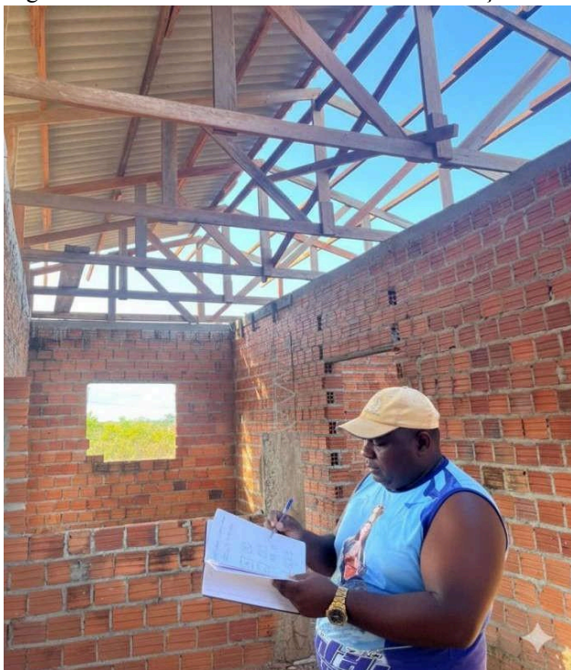
Figura 10 - Pedreiro realizando cálculos e anotações durante a obra

Sob a perspectiva da Etnomatemática, tais práticas podem ser compreendidas como formas legítimas de produção e ressignificação do conhecimento matemático em contextos socioculturais específicos. Os pedreiros não apenas utilizam conceitos matemáticos, mas os reinterpretam e adaptam às suas práticas profissionais, construindo modos próprios de registrar, organizar e aplicar informações numéricas e espaciais.