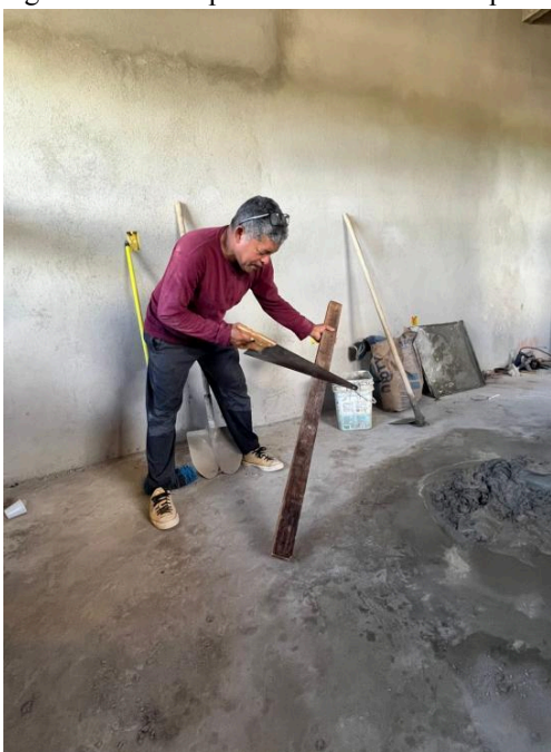
Figura 9 - Participante D usando serrote para cortar madeira