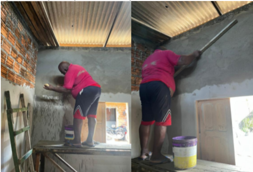
Figura 7 - Participante A aplicando reboco em parede

diretamente em um carrinho de mão ou em uma superfície limpa, até atingir a consistência ideal para aplicação.