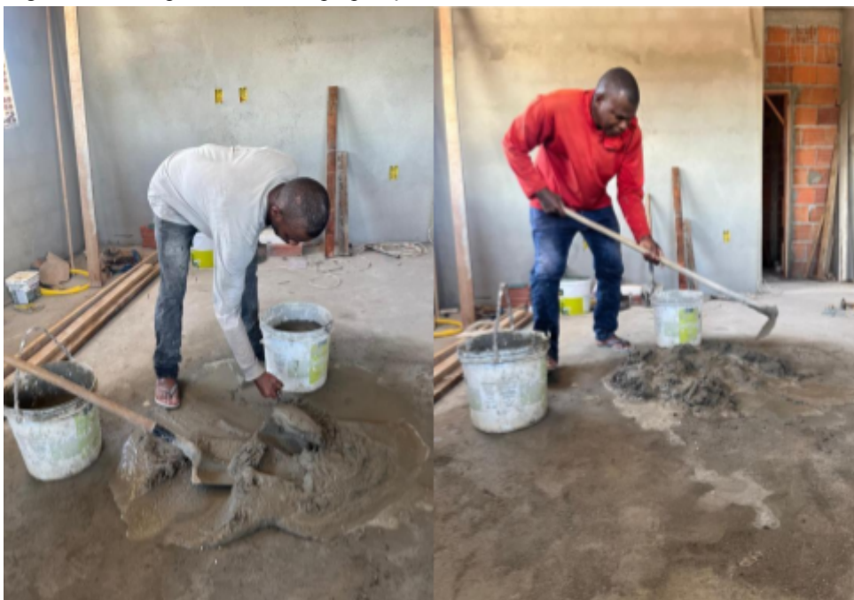
Figura 6 - Participantes B e C na preparação da massa