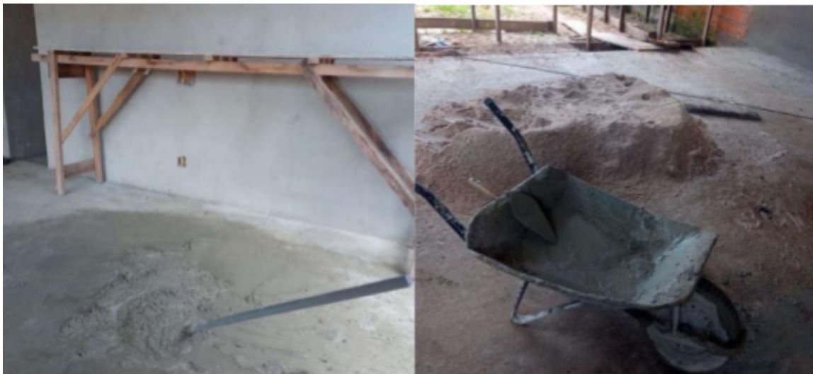
Figura 5 – Materiais da massa

pedreiros organizam os materiais e realizam estimativas com base em referências próprias, construídas no cotidiano da obra. Esse tipo de raciocínio revela um saber matemático situado, característico da Etnomatemática, no qual o conhecimento emerge da prática social e cultural, e não de conteúdos escolares formais.