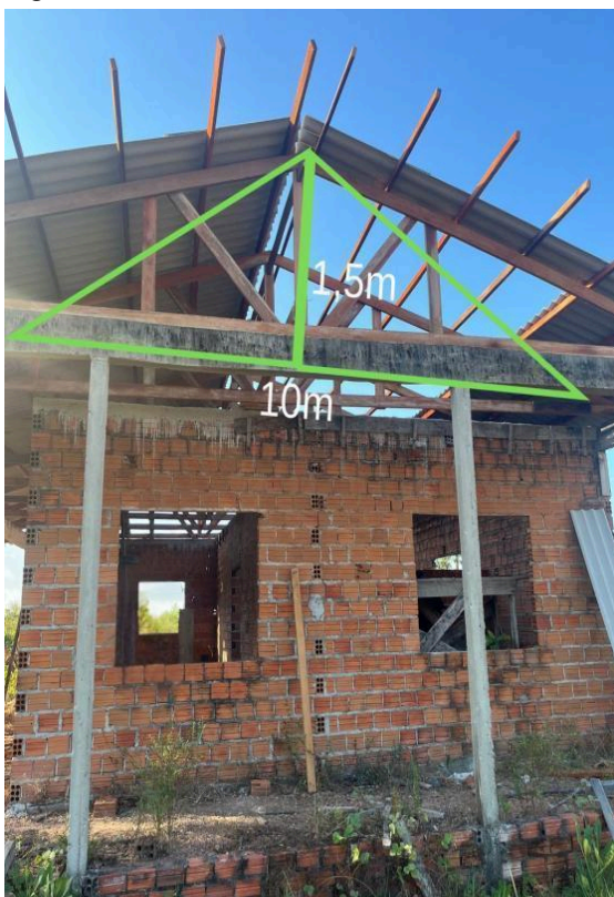
Figura 8 - Caimento do telhado

“A parte de baixo do telhado, tem quase 10 metros, aí faço quinze por cento né, ficando um e meio de altura, aí fica bom e escorre bem a água.”