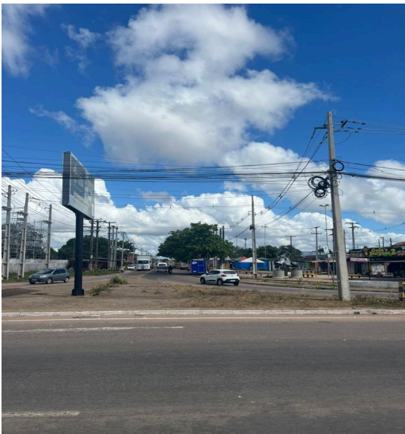
Figura 1 - Entrada da Rodovia AP-070/BR-156, via de acesso principal à Comunidade Quilombola do Curiaú

A pesquisa foi desenvolvida na comunidade Curiaú, localizada na zona norte do município de Macapá, estado do Amapá, a margem da Rodovia AP-070, aproximadamente 8 km do centro urbano da cidade. Trata-se de um território oficialmente reconhecido como comunidade remanescente de quilombo, caracterizado por forte identidade histórica, cultural e social, construída a partir da resistência, da ancestralidade e da organização coletiva de seus moradores. A escolha desse local não se deu de forma aleatória, mas fundamenta-se em critérios teóricos e metodológicos diretamente relacionados aos objetivos do estudo e ao referencial da Etnomatemática.