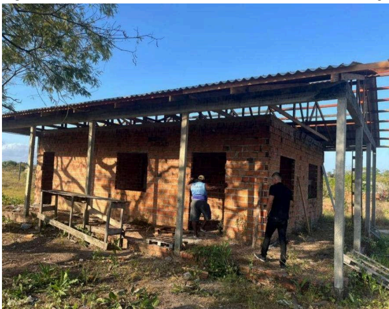
Figura 11 - Vista lateral da obra observada durante a entrevista de campo