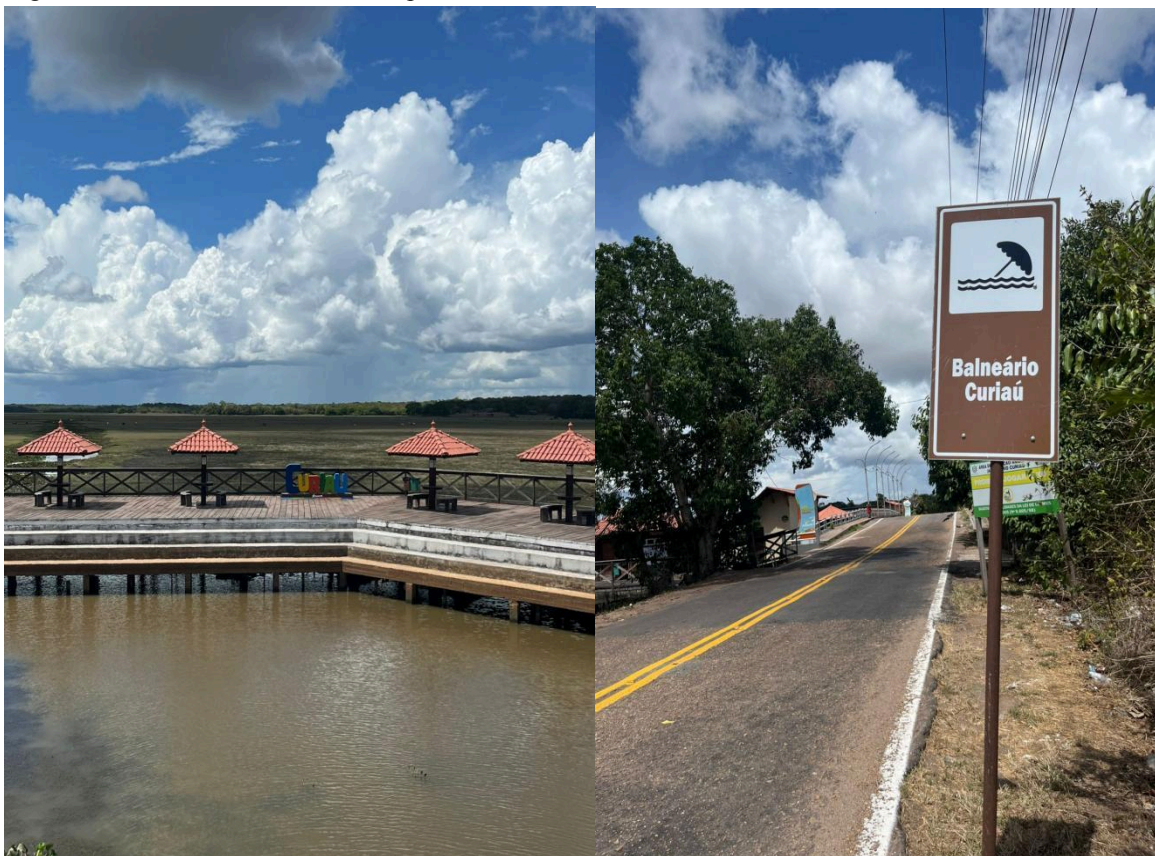
Figura 2 - Balneário do Curiaú, Macapá-AP

presença reforça as características socioculturais e territoriais do local, evidenciando a integração entre os saberes tradicionais da população quilombola e o ambiente natural em que vivem, configurando um contexto singular para a realização desta pesquisa.