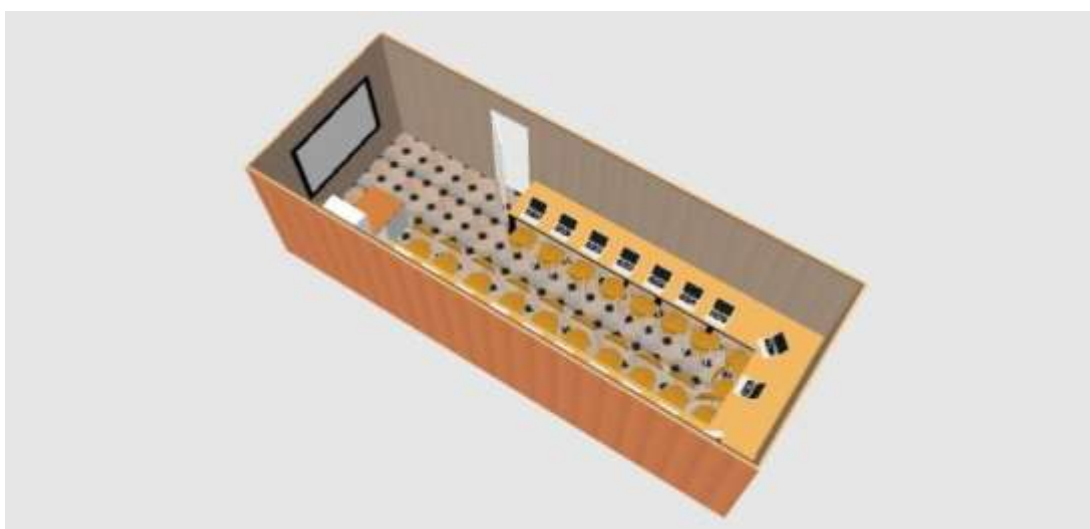
Figura 04 – Planta tridimensional do laboratório de informática