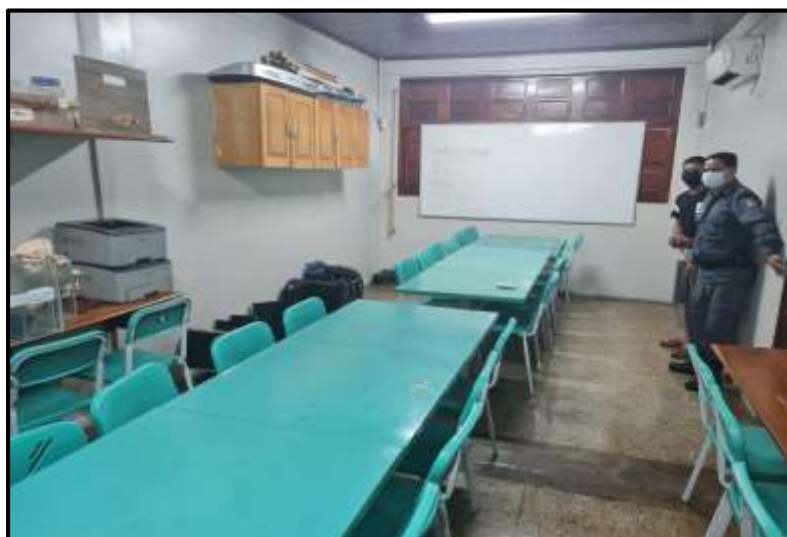
Figura 02 – Laboratório ocioso na E.E. Prof. Antonio Messias G. Da Silva

Como o intuito de levar um laboratório de informática para um espaço ocioso dentro de instituição de ensino da rede pública, elaboramos a seguinte proposta que visa abraçar todo o trabalho e gerar resultados que não só beneficia aqueles que usufruirão do laboratório, mas sim de todo corpo estudantil que tentará tornar esse projeto possível. Na figura a seguir é possível visualizar o laboratório de Química que se encontra ocioso dentro da instituição, como mostra a imagem abaixo.