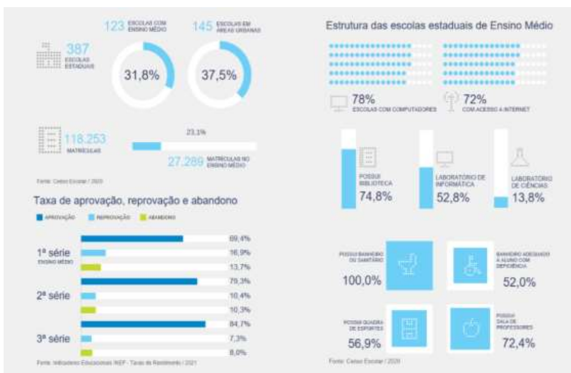
Figura 01 – Panorama do Território Amapá