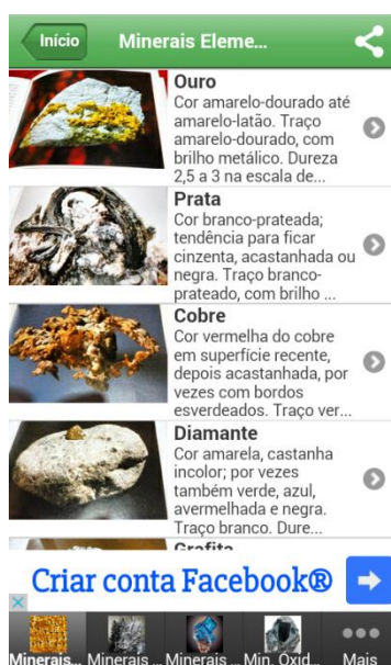
Figura 2: Opção de minerais elementos selecionada.

Dando prosseguimento, ao selecionar uma das opções da interface inicial, abrirá a lista de minerais correspondentes ao grupo, como vemos na Figura 2, onde a opção de minerais elementos está sendo exemplificada como seção selecionada.