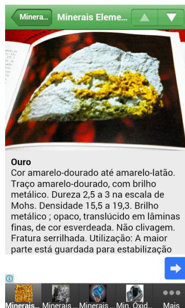
Figura 3: Interface de resultado final da busca, na opção ouro.

Assim vemos que o uso correto do aplicativo BuscaMin é simples e disponível para todos, não exigindo habilidades técnicas ou conhecimentos específicos para sua plena utilização.